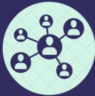
Equipo Directivo y Equipo de Gestión