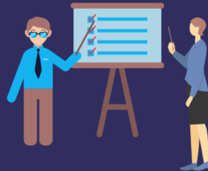
Profesoras y Profesores