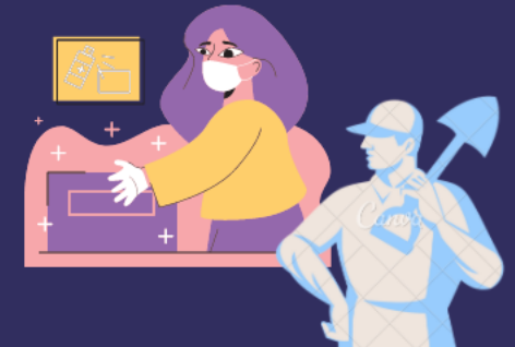
Auxiliares de Servicios