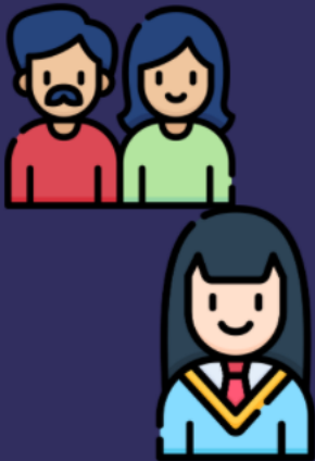
Estudiantes y Familias